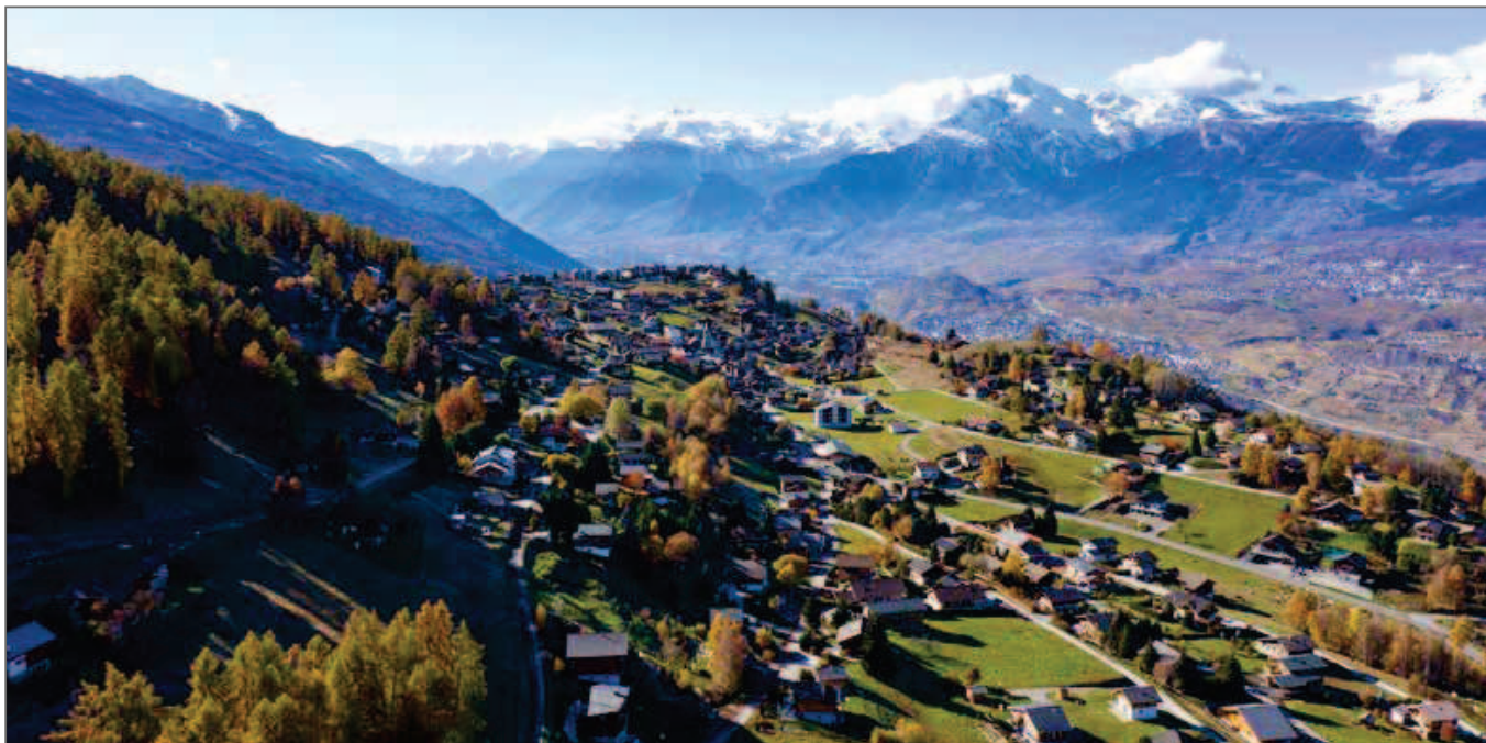
Une priorité pour Mont-Noble: la préservation du patrimoine.

consiste à favoriser la mobilité douce. Nous avons donc développé un projet de télécabine entre Bramois/Sion et Nax. Le projet a reçu un préavis favorable de l'Office fédéral des transports (OFT) et pourrait se concrétiser en 2026. Actuellement, la liaison est effectuée par des cars postaux, dont les horaires ne sont plus vraiment adaptés à la vie actuelle. A partir de 18 heures, par exemple, les parents passent leur temps à faire le chauffeur de leurs enfants pour les amener à leurs différentes activités en plaine. L'objectif est de proposer une liaison plus efficace, mais aussi plus écologique. Avec